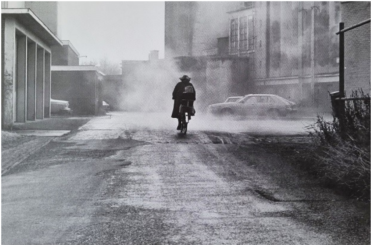
De Lange Stammerdijk liep door het fabrieksterrein van Sluis.